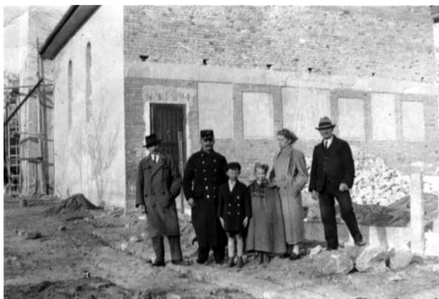
Templomépítés Pestszentlőrincen 1935-ben.