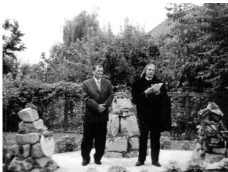
Lezsák Sándor ünnepi beszéde