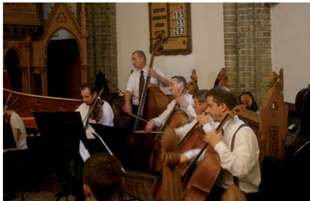
A Budapesti Vonósok koncertje a Nagy Ignác utcai templomunkban