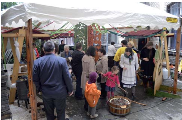
Meseudvar a szeptember 26-ai Belvárosi Unitárius Kulturális Napon

Szeptember 26-án, szombaton 10 órától került sor a Budapesti Unitárius Kulturális Nap megrendezésére, a Nagy Ignác utcai templom épületében és udvarán. A délelőtti programok elsősorban a gyermeknek és családoknak szóltak. Sajnos az idő nem volt kegyes a kulturális napra ellátogatókhoz, az eső szinte egész nap csendesen esett és a hőmérséklet sem haladta meg a 10 fokot. Ezért az udvari programokat csak sátrak alatt tudtuk megrendezni, illetve a színpadi programokat a gyülekezeti teremben voltunk kénytelenek megtartani.