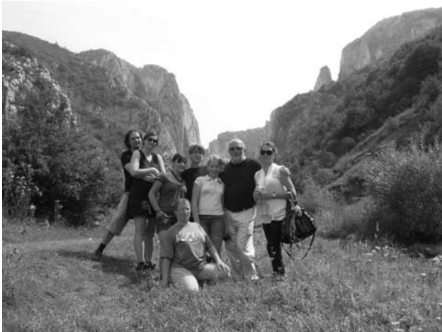
A kiránduló csapat